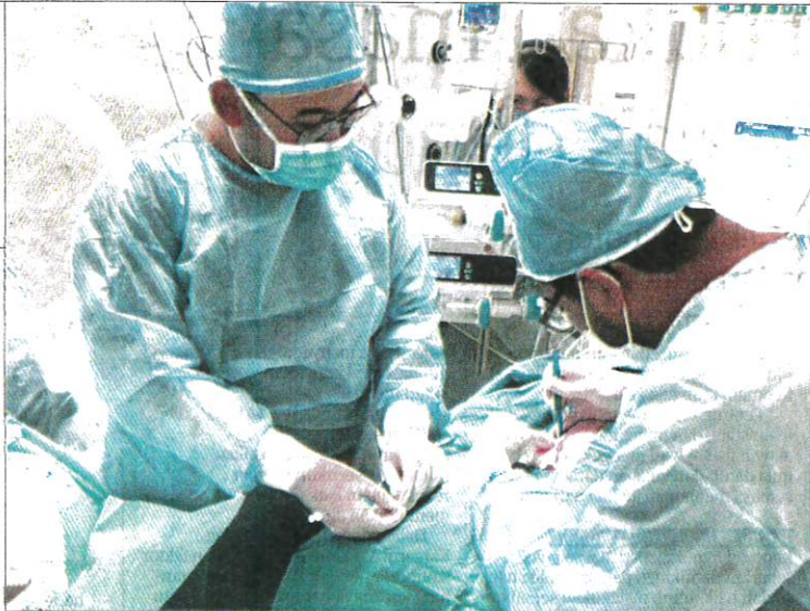
Pemindahan organ antara kaedah rawatan yang diberikan kepada pesakit buah pinggang. (Foto hiasan)