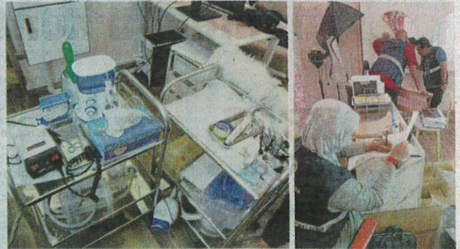
JKN Selangor menyerbu sebuah premis salon kecantikan yang menawarkan khidmat veneer gigi secara haram di Damansara Perdana, Petaling Jaya pada Rabu.

"Pelanggan perlu membuat temu janji dan bayar deposit terlebih dahulu untuk