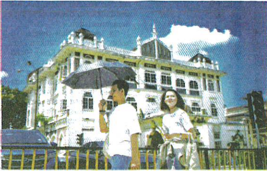
ORANG ramai dinasihatkan agar mengehendkan aktiviti di luar rumah ketika cuaca panas melanda negara ketika ini. - GAMBAR HIASAN

KOTA BHARU – Seorang kanak-kanak lelaki berusia tiga tahun meninggal dunia pada Isnin lalu akibat strok haba selepas empat hari menerima rawatan di Hospital Universiti Sains Malaysia (HUSM), di sini.